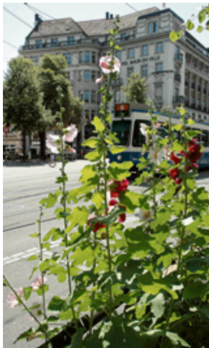
Bellebtes Fotosujet an der Bahnhofstrasse.

Heute profitiert von ihm der Kreis 3 als neuer Wohnort des 56-Jährigen. Und wieder zieht sich eine blühende Linie